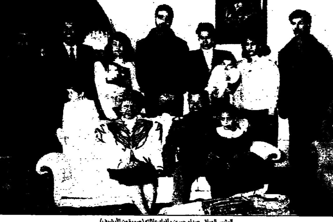
الرئيس العراقي صدام حسين واقرامه